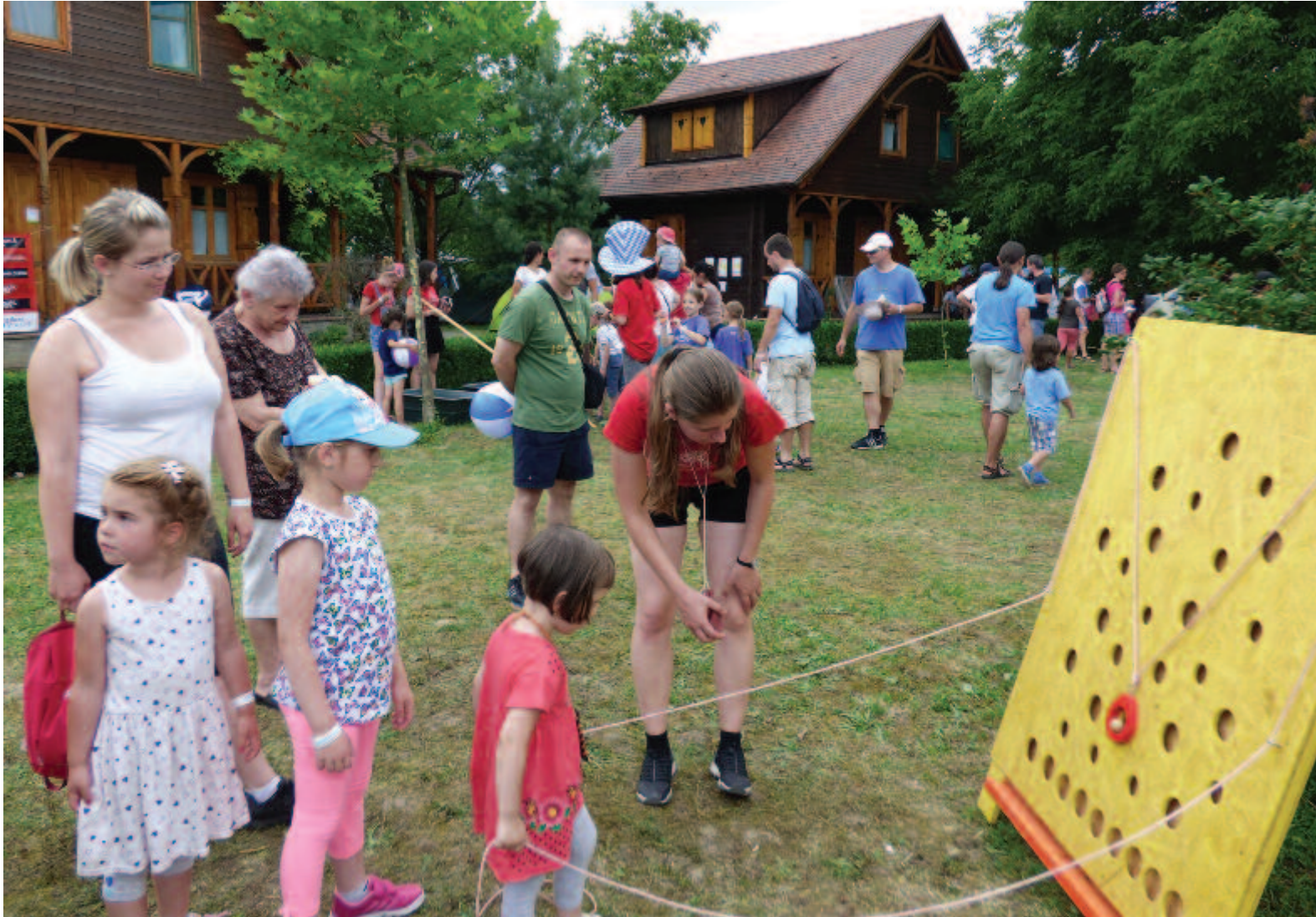
Huszonkilenc játék és tizenhat kézműves-foglalkozás várta a gyerekeket